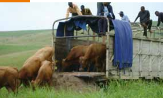
Arrivée des géniteurs de race plus productive à Feshi