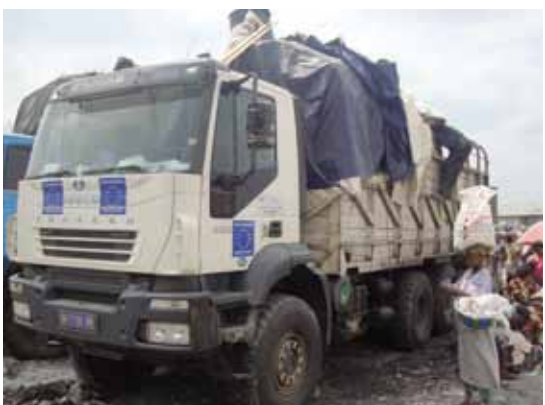
Un des 6 camions Eurotrucker (20 tonnes)

L'élevage a été décimé par les pillages que le Pays a connu à la fin des années 90 notamment. La reconstitution des cheptels est une des priorités des populations. Depuis 2004, plusieurs tentatives de promotion d'élevages ont été réalisées par ISCO: les résultats les plus probants, et de loin, sont obtenus avec les bovins introduits à Feshi et Kahemba, la vaccination des poules et les chenilles.