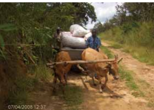
Charrette transportant les produits agricoles à Bagata