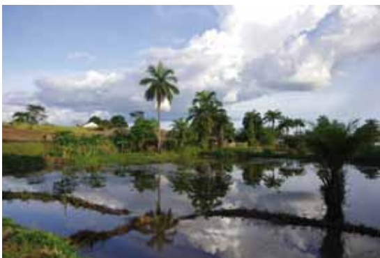
Étangs piscicoles à Bagata