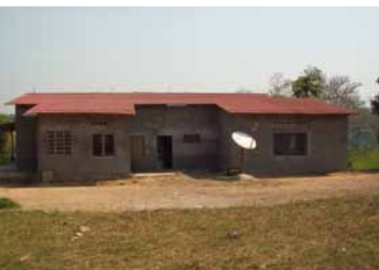
Bureau faitière du territoire de Popokabaka