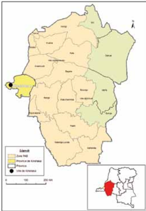
La province de Bandundu et Kinshasa