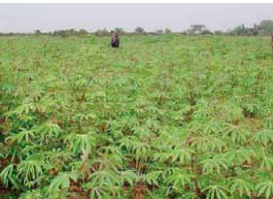
Parc à bois de manioc amélioré à Lusekele (Bulungu)