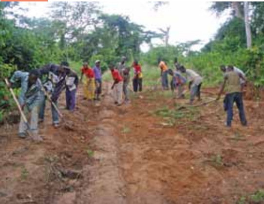
GVER en pleine activité à Zhina Bunkete (Kasongolunda)

Des GVERs (groupe des volontaires d'entretiens routiers), liés aux CDV (Communautés de développement du village), assurent les travaux à faible coût grâce au soutien des projets.