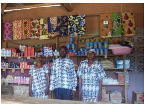
Magasin de coordination au village Kolokoso (Kenge)