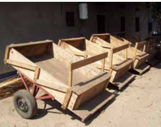
Charrettes avant distribution à Kahemba