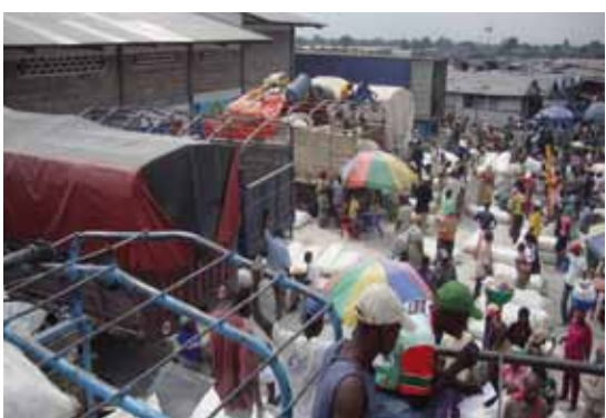
Parking au Marché de la liberté à Kinshasa