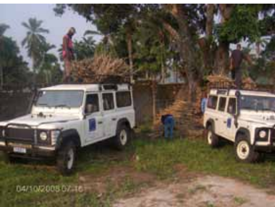
Transport en vue de distribution des boutures de manioc à Popokabaka