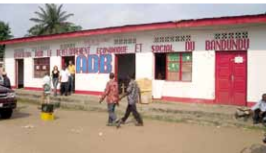
Bureau faitière du territoire de Kenge