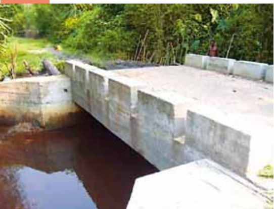
Pont construit sur Lunkuni dans Bagata