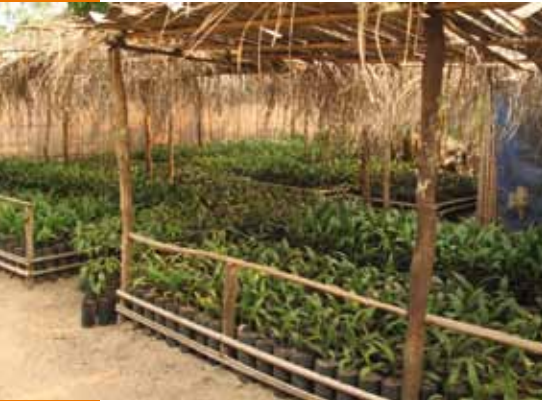
Pépinière de palmiers à huile à Feshi